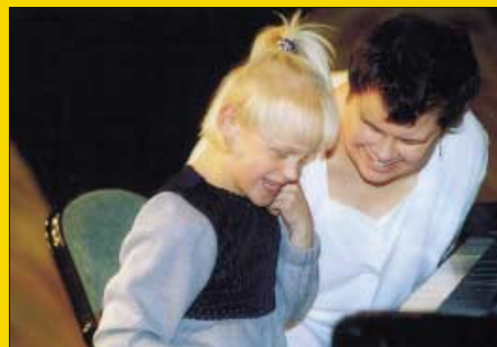
Hráli jsme, zpívali a děkovali donátorům a příznivcům